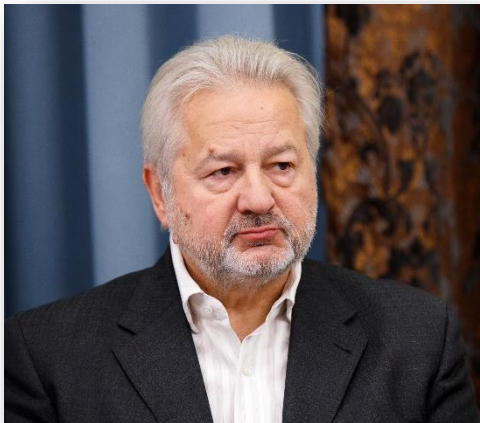
Лермонтов Михаил Юрьевич

Культура – навигационная система жизнеустроения бытия – стратегический ресурс жизнеспособности Русской цивилизации